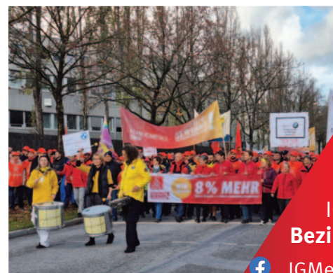
München: 5000 BMWler im Ausstand.