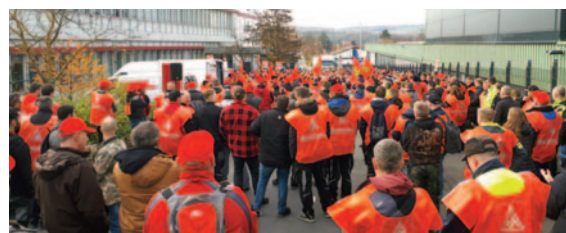
Marktheidenfeld: 900 Warnstreikende.