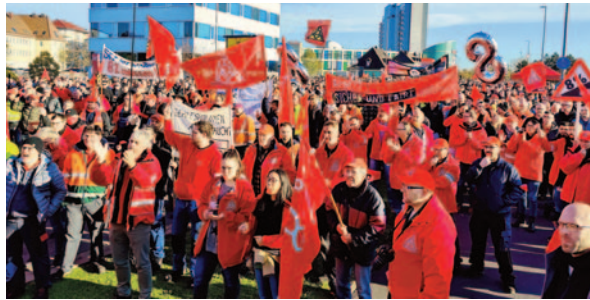
Schweinfurt: Kundgebung von 4500 Beschäftigten.