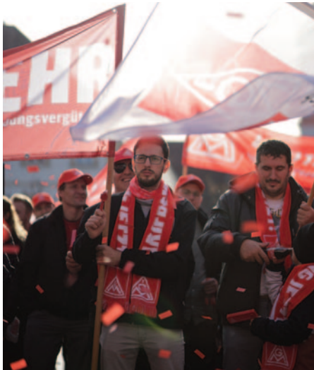
Weißenburg: zentrale Kundgebung.