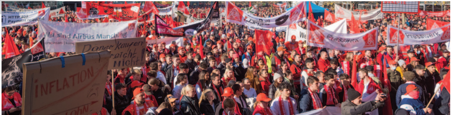
Ingolstadt: 20.000 Warnstreikende auf der Audi-Piazza.