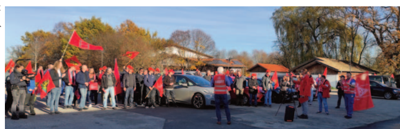
Weilheim: Gemeinsame Kundgebung mehrerer Unternehmen.