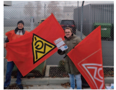
Amberg: 1550 Siemensianer.