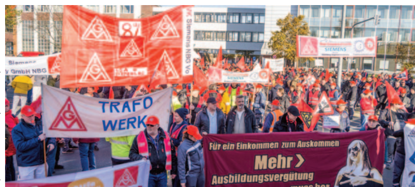
Nürnberg: 5000 Beschäftigte aus 37 Betrieben auf der Straße.

Bayern: „Die Beschäftigten sind geplagt von Geldsorgen und erleben jetzt, wie die Arbeitgeber diese Tarifrunde blockieren. Unsere Leute sind zurecht stinksauer. Wenn die Arbeitgeber mit dem heutigen Warnstreiktag nicht verstanden haben, wozu die Beschäftigten bereit und in der Lage sind, dann ist ihnen nicht mehr zu helfen.“