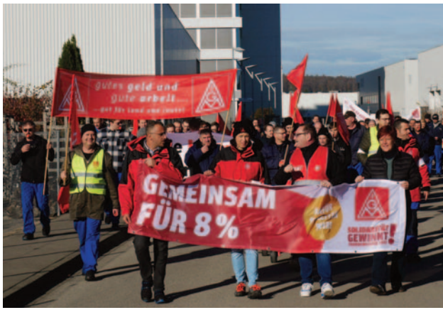
Mindelheim: 1500 Warnstreikende von Grob.