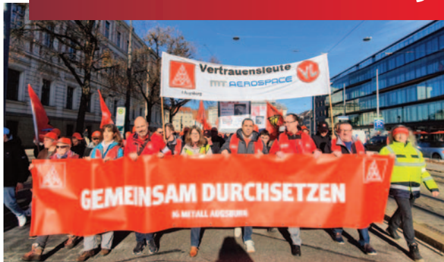
Augsburg: 5800 Beschäftigte legten die Arbeit nieder.