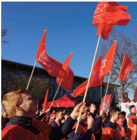
Dingolfing: Azubi-Warnstreik, BMW BIZ.