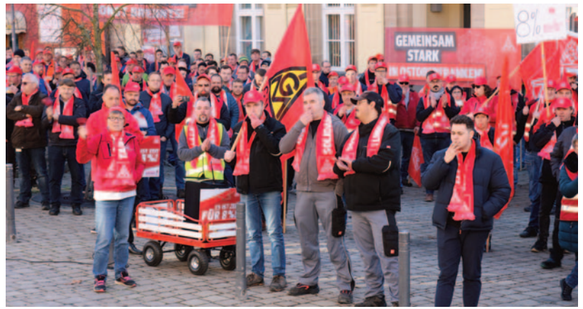
Pegnitz: 750 Metaller*innen bei Kundgebung mit Demonstrationszug.